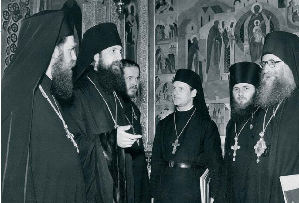
Mgr Basile à Jérusalem, juin 1960

L'Institut Saint-Serge était honoré de sa participation active aux congrès liturgiques qui ont lieu chaque année à la fin du mois de juin. En septembre 1985, Mgr Basile se rend en Russie. Les 12 et 15 septembre, il célèbre sa dernière divine liturgie dans sa ville natale, dans l'église où il avait reçu le sacrement du baptême. Après l'office, il éprouve un malaise et doit être hospitalisé. Il décède le 22 septembre et est inhumé au cimetière Saint-Séraphim de Saint-Petersbourg 5 .