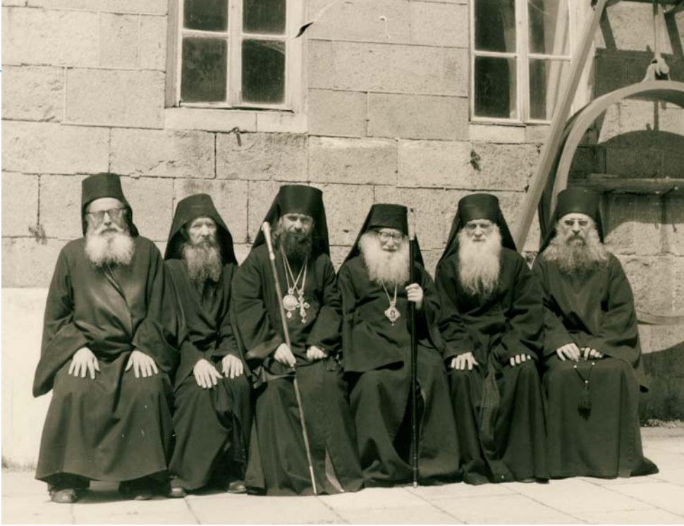
Monastère Saint-Pantéléïmon. Mont Athos, 1977.