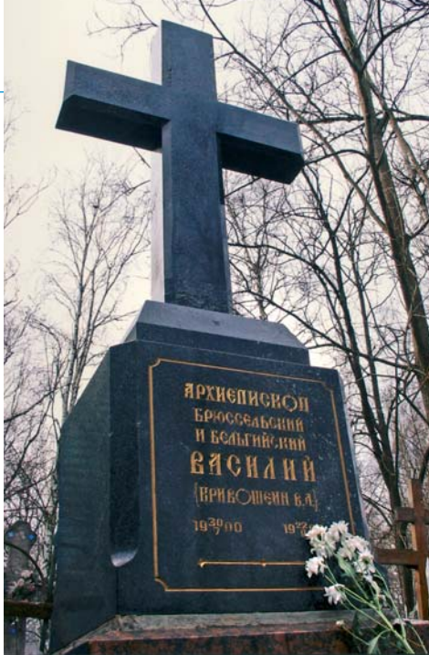
Tombe de Mgr Basile à Saint-Pétersbourg