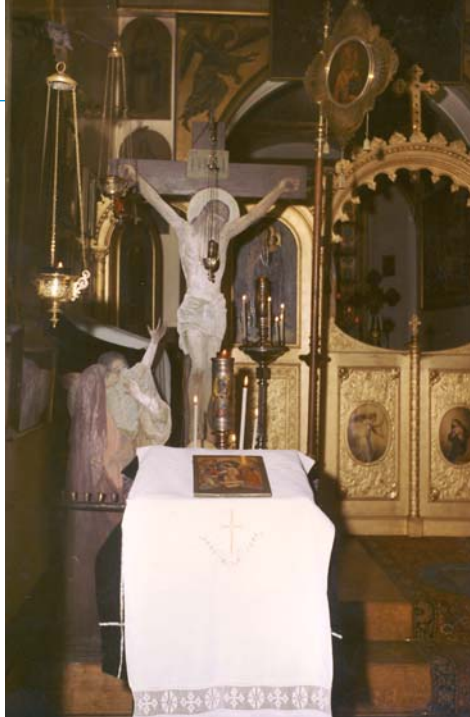
Église russe Saint-Nicolas à Bruxelles

ne me permettent justement pas d'acquérir l'expérience suffisante d'une vaste activité pastorale dans le domaine administratif, expérience si nécessaire pour un évêque. En effet, malgré le principe que les saints apôtres ont établi pour leurs successeurs: « il n'est pas convenable que nous laissions la parole de Dieu pour servir aux tables... Et nous, nous continuerons à nous appliquer à la prière et au ministère de la parole 8 », ce n'est pas par ces paroles que je pourrai me justifier devant Jésus-Christ lors du Jugement dernier, de mon inexpérience dans les affaires de l'Église et de ma négligence du salut des âmes humaines.