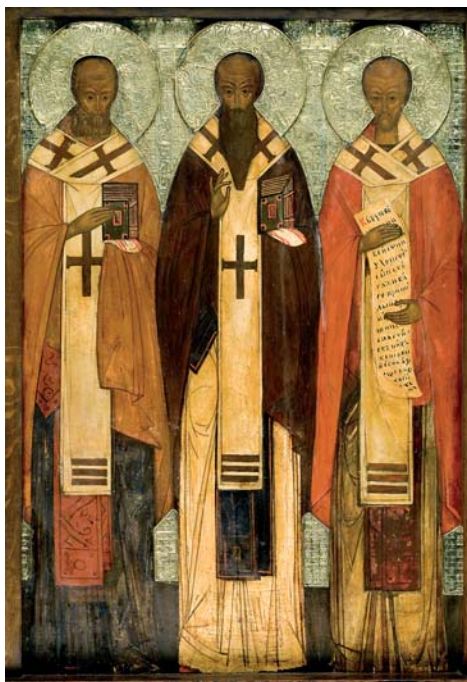
Saints Grégoire le Théologien, Basile le Grand et Jean Chrysostome. Église des Trois-Saints-Docteurs. Paris

[Pour saint Basile], une rupture de communion ecclésiastique n'est justifiée que lorsqu'il s'agit vraiment de questions essentielles de la foi chrétienne, fondamentales pour notre salut. Rien de plus regrettable que de se diviser pour des raisons qui ne concernent pas directement notre foi. Cette attitude de saint Basile, irénique et tout