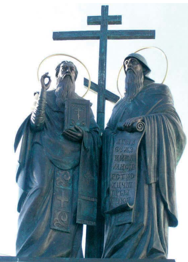
Monument à saints Cyrille et Méthode à Kolomna