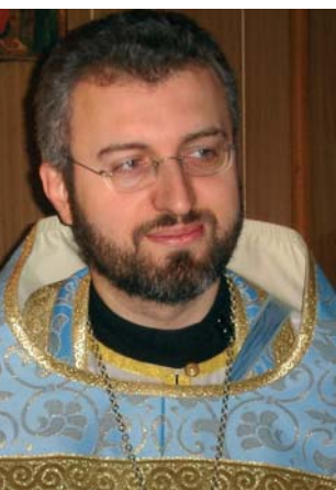
P. Serge Model

Contrairement à d'autres périodes de sa vie, au sujet desquelles il a rédigé des « mémoires », l'archevêque Basile (Krivochéine) n'a pas laissé de souvenirs sur les vingt-deux années qu'il a passées au Mont Athos. Or, cette partie de sa vie est sans conteste l'une des plus importantes dans la formation de sa personnalité ; c'est l'Athos qui a fait de Mgr Basile ce qu'il sera toujours fondamentalement (avant même l'évêque ou le théologien) : un humble moine, menant une