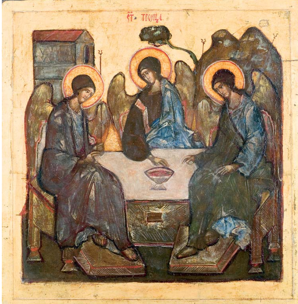
Sainte Trinité. Icône du père Grégoire Krug. Église orthodoxe de Vanves

ce qui est consacré par des décisions œcuméniques, universelles doit être respecté par tous. Cependant, ce qui a été exposé d'une manière particulière par tel ou tel Père de l'Église ou décidé par un concile local n'altère pas la pensée de ceux qui respectent ces dispositions. Pour ceux qui ne les ont pas acceptées, leur non-observance n'est pas dommageable. » Mais, quelques années plus tard, saint Photius a, dans un message à son troupeau daté de 867, soumis à une sévère critique les rites romains que l'on imposait en Bulgarie. Cette critique ne s'expliquait pas par un changement d'attitude de saint Photius (il tolérait auparavant les rites romains sans pour autant les encourager) mais avait pour raison que l'amour des missionnaires romains s'était tari, qu'ils s'étaient mis à appliquer leurs pratiques d'une manière rigide, sans tenir compte des particularités des peuples slaves. Le concile de Constantinople (879-880) confirme la liberté dans le choix des rites et des traditions liturgiques pour les Églises locales