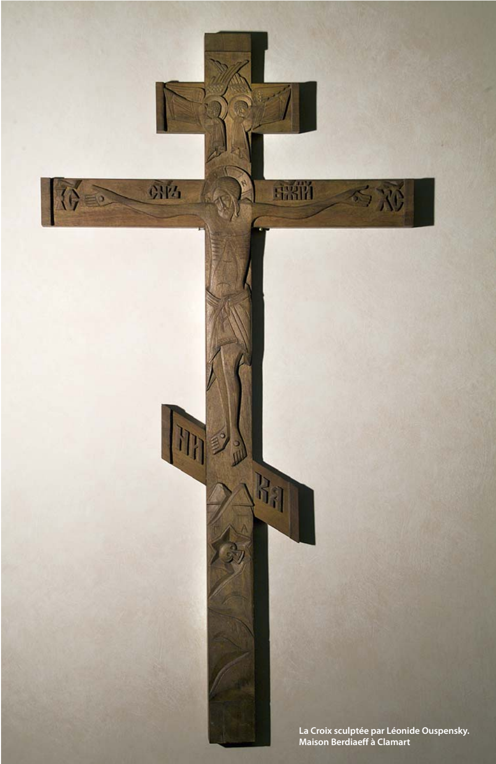
La Croix sculptée par Léonide Ouspensky. Maison Berdiaeff à Clamart