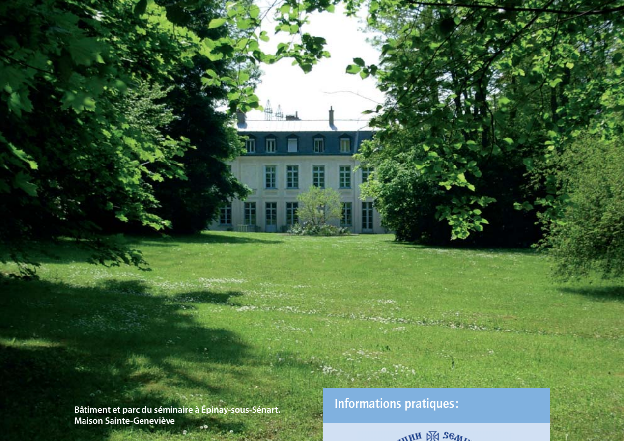
Bâtiment et parc du séminaire à Épinay-sous-Sénart. Maison Sainte-Geneviève

lectuelle de l'établissement. Les détails sont communiqués sur le site du séminaire (en français et en russe): www.seminaria.fr .