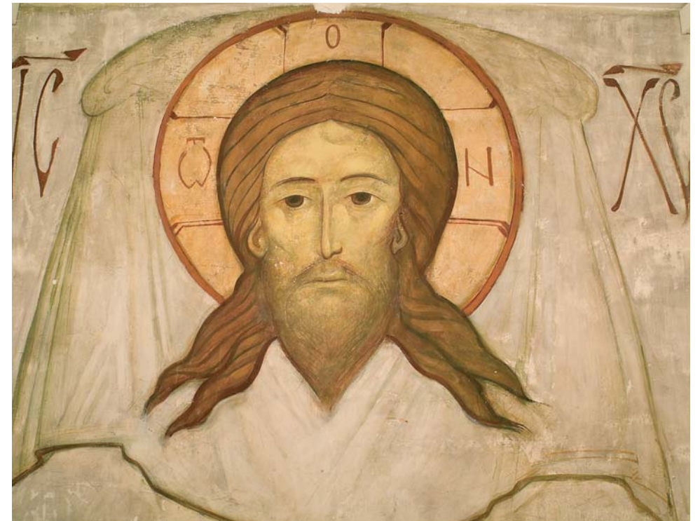
Fresque du P. Grégoire Krug. Église des Trois-Saints-Docteurs. Paris.