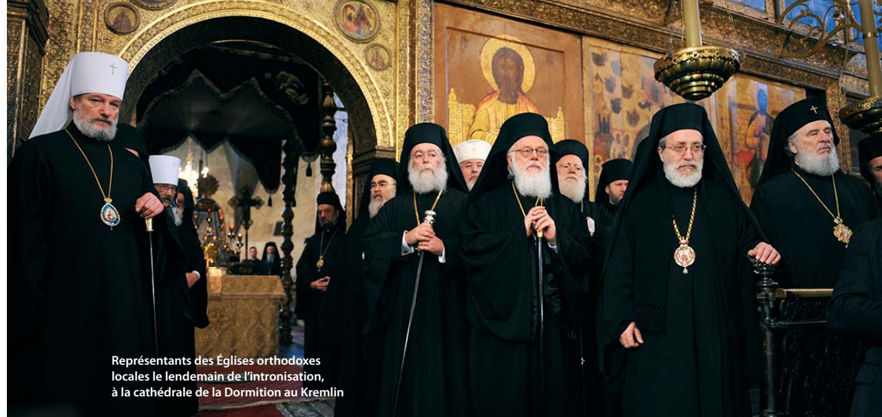
Représentants des Églises orthodoxes locales le lendemain de l'intronisation, à la cathédrale de la Dormition au Kremlin

Le témoignage de l'Église au monde suppose non seulement la prédication du haut de la chaire ecclésiale, mais aussi un dialogue ouvert, bienveillant et intéressant avec le monde