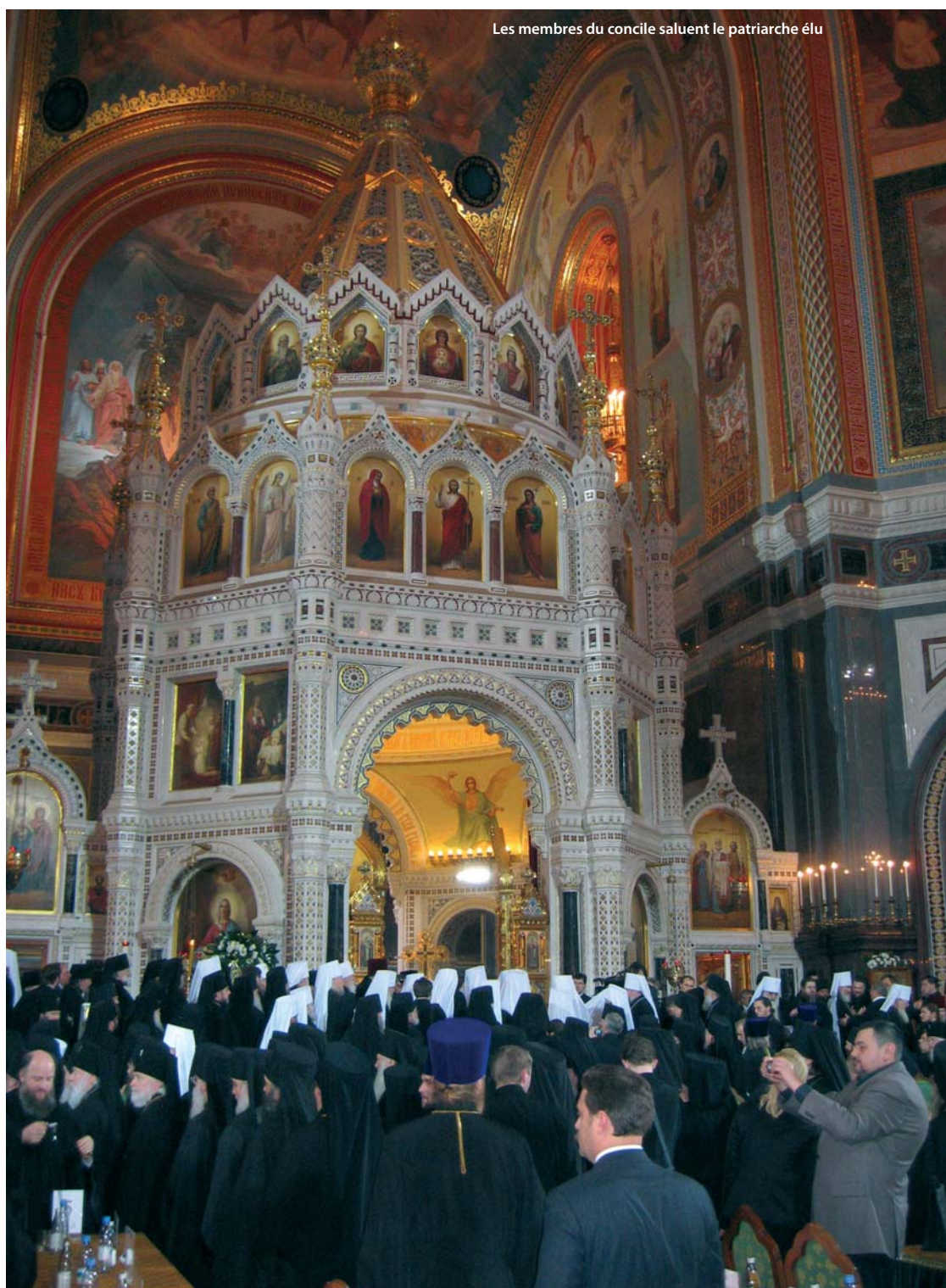
Les membres du concile saluent le patriarche élu

Clément, 23 pour aucun des deux candidats. Aussi, Mgr Cyrille obtint 72 % des voix, Mgr Clément – 24 %, tandis que 4 % se sont abstenus. À l'annonce de ces résultats, toute l'assemblée se leva pour chanter un stichère de Pentecôte : « Aujourd'hui, c'est la grâce de l'Esprit Saint qui nous a réunis... ». Le métropolite Vladimir de Kiev demanda à Mgr Cyrille s'il était d'accord d'assumer le ministère patriarcal. Sa réponse positive fut suivie d'un office d'action de grâce. Tous les membres du concile saluèrent ensuite le patriarche élu auprès des portes royales de l'iconostase. Nous quittâmes la cathédrale peu avant minuit.