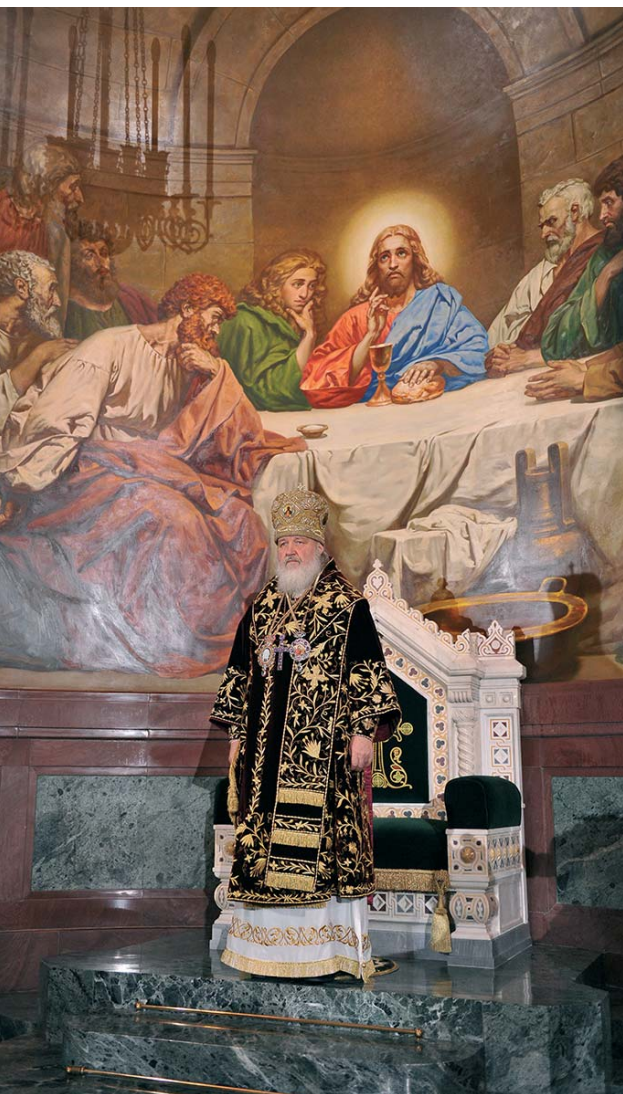
Sur la chaire patriarcale de la cathédrale Christ-Sauveur de Moscou

de la Fédération de Russie, Monsieur Dimitri Medvedev, et de son épouse, du premier ministre Vladimir Poutine, du président de la République de Moldavie et de son épouse, de Madame Eltsine, épouse du défunt président russe, ainsi que de nombreux représentants de la Douma (le parlement russe) et du corps diplomatique.