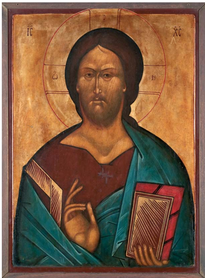
Christ Sauveur. Icône de L. Ouspensky. Collection privée

La Première guerre mondiale apporte beaucoup de malheurs à l'Église orthodoxe de Pologne. Une partie considérable de ses fidèles fuient les régions