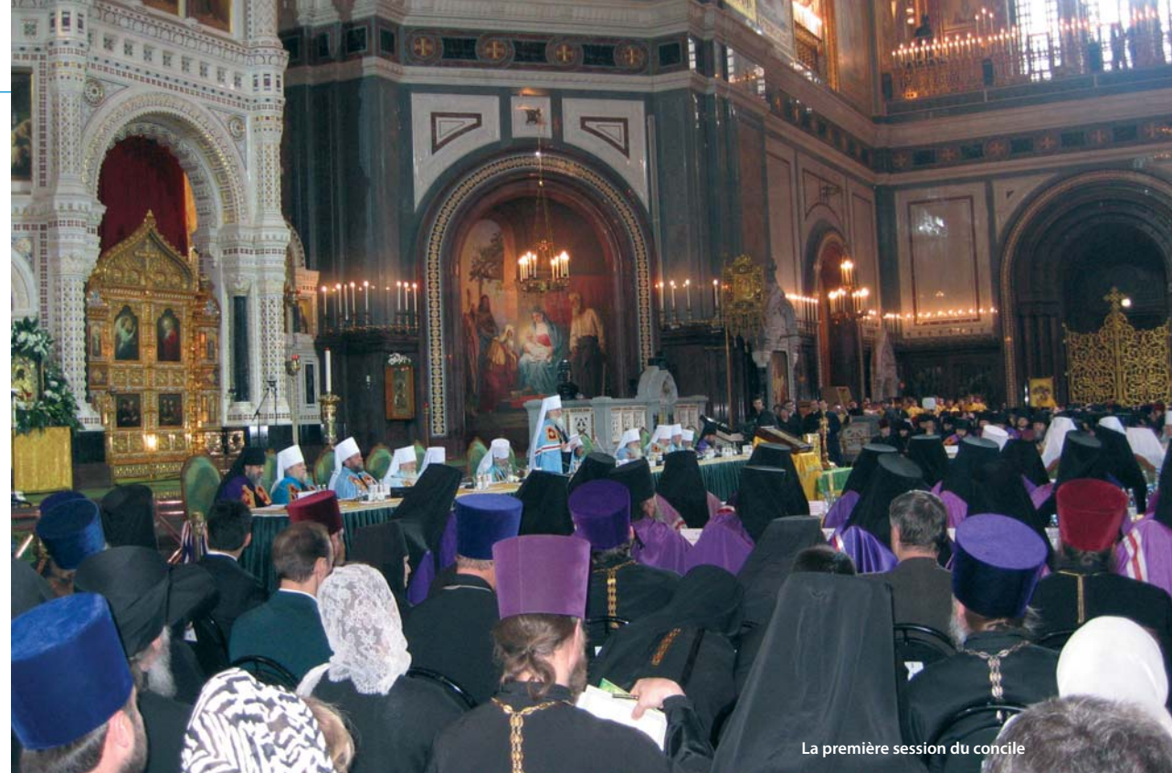
La première session du concile

En conclusion, j'aimerais dire que l'élection du patriarche Cyrille donnera certainement une nouvelle impulsion à la vie de l'Église en Russie et dans les autres pays de l'ex-espace soviétique, insufflera une nouvelle force aux relations entre chrétiens, aux rapports entre religions et élèvera à un autre niveau les contacts entre le patriarcat de Moscou et le monde extérieur.