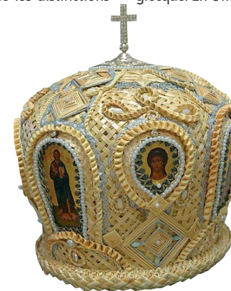
Mitre épiscopale contemporaine

Dans la Russie médiévale, le patriarche portait pendant les célébrations une coiffe épiscopale bordée de fourrure, tout comme les autres évêques. Cette version russe des mitres épiscopales, qui n'a pas d'analogie dans la tradition grecque byzantine, s'explique par les froids hivernaux en Russie où la plupart d'églises n'étaient pas chauffées, ou l'étaient insuffisamment. La coiffe épiscopale du patriarche russe se distinguait de celle des autres évêques du pays par la présence d'une croix au sommet. La mitre byzantine grecque fut portée pour la première fois en Russie par le patriarche Nikon (1652-1666) qui souhaita se conformer à l'usage