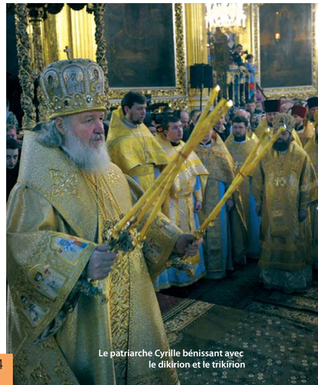
Le patriarche Cyrille bénissant avec le dikirion et le trikirion

En dehors de la liturgie, le patriarche de Moscou se distingue des autres évêques par le port du koukol blanc (chapeau monastique arrondi) surmonté d'une croix. Par ailleurs, la cappa magna du patriarche est de couleur verte, alors que celle des métropolitains est bleue et celle des évêques et des archevêques, violette.