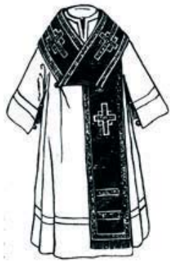
Le grand omophore revêtu par-dessus le sakkos